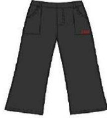
GREY TROUSERS GIRLS