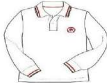
LONG SLEEVE POLO T-SHIRT