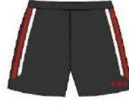
PE SHORTS BOYS