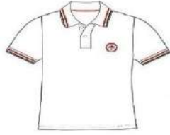
SHORT SLEEVE POLO T-SHIRT