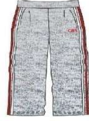
PE PANTS GIRLS