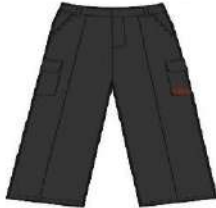
GREY CARGO TRS. BOYS