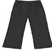
GREY TROUSERS GIRLS