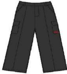
GREY CARGO TRS. BOYS